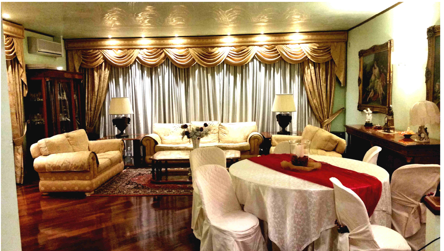
LA SALA ORO