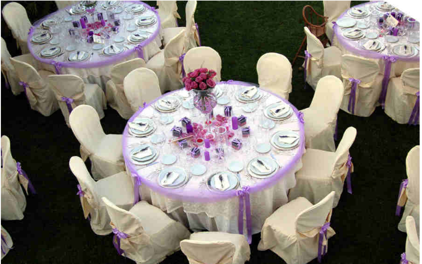
Un tipo di allestimento della tavola