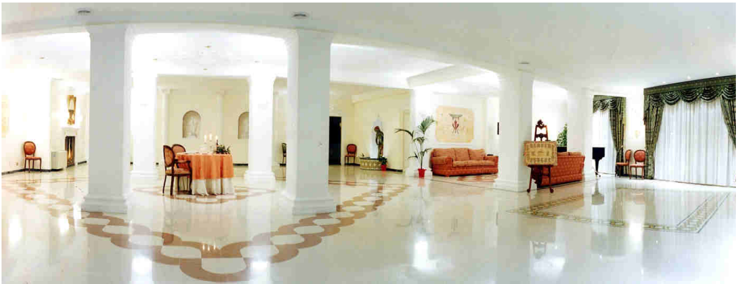
LA SALA VERDE