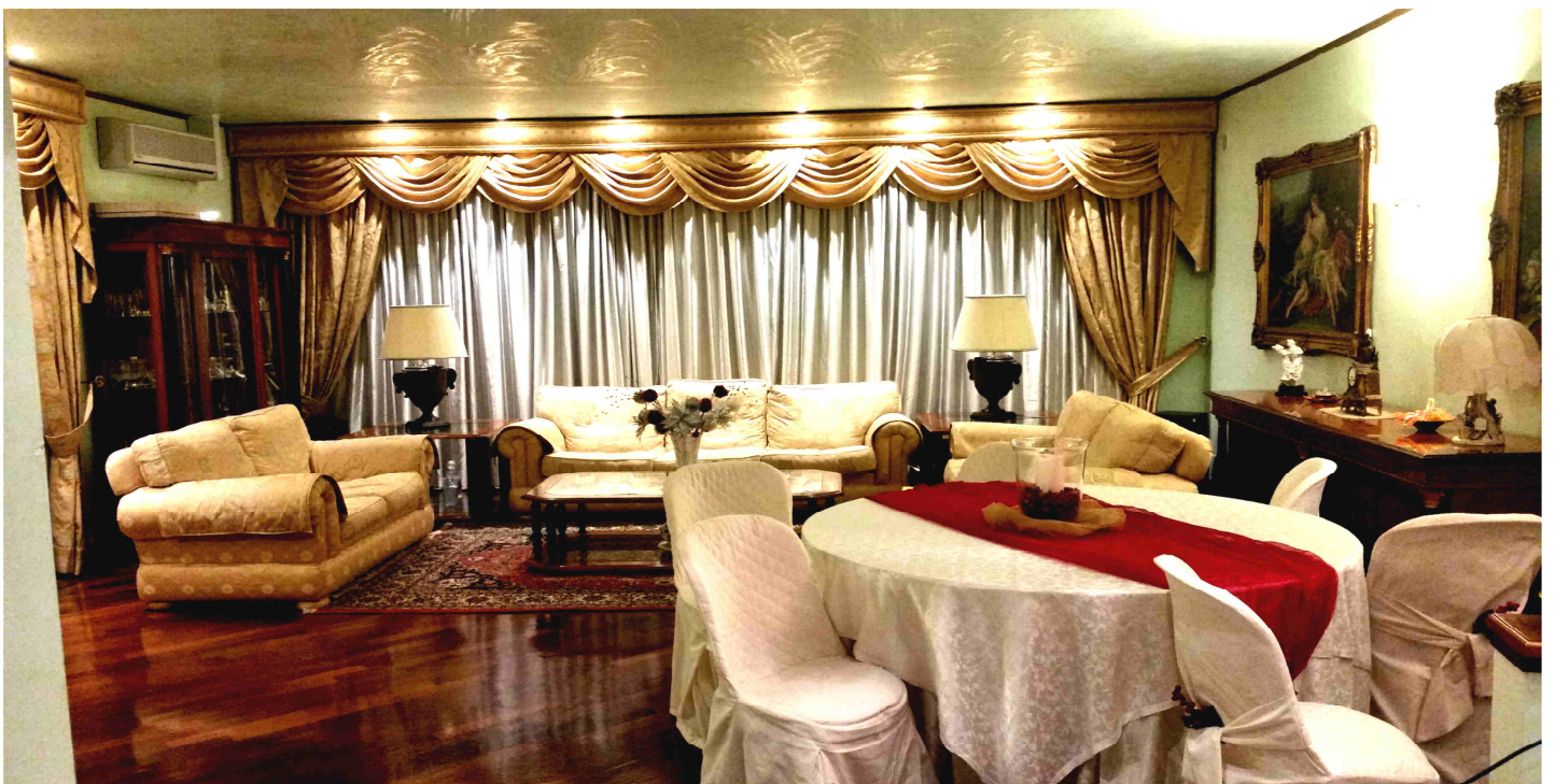
LA SALA ORO